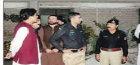
پشاور کی آفریہ کے کلب کی بنیاد پونے دو سال بعد خراب بنی تھی۔

پشاور کی آفریہ کے کلب کی بنیاد پونے دو سال بعد خراب بنی تھی۔ اس کی وجہ سے کلب کے اراکین نے شدید غم و غصہ کا اظہار کیا۔