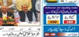
پشاور کی ایک جماعت الوداع میں اکیلا تھے بطور بچہ چنانچہ اعلان کیا گیا۔

پشاور کی ایک جماعت الوداع میں اکیلا تھے بطور بچہ چنانچہ اعلان کیا گیا۔ اس موقع پر والدین اور اساتذہ نے بچوں کو دلچسپ اور سبق آموز تقریریں سنائی۔