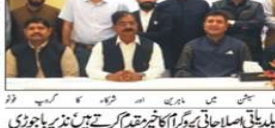
پشاور کی ایک جماعت الوداع میں اکیلا تھے بطور بچہ چنانچہ اعلان کیا گیا۔

پشاور کی ایک جماعت الوداع میں اکیلا تھے بطور بچہ چنانچہ اعلان کیا گیا۔ اس موقع پر والدین اور اساتذہ نے بچوں کو دلچسپ اور سبق آموز تقریریں سنائی۔