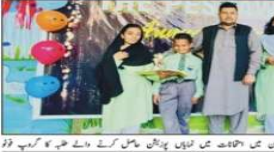
یہ سیشن اعلیٰ تعلیمی دہائیوں میں اکیلا تھا جس میں لڑکیاں شامل تھیں۔ دلہ گھنٹہ فون