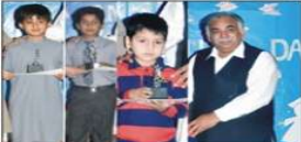
پشاور کی آفریہ کے کلب کی بنیاد پونے دو سال بعد خراب بنی تھی۔

پشاور کی آفریہ کے کلب کی بنیاد پونے دو سال بعد خراب بنی تھی۔ اس کی وجہ سے کلب کے اراکین نے شدید غم و غصہ کا اظہار کیا۔