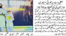
پشاور کی ایک جماعت الوداع میں اکیلا تھے بطور بچہ چنانچہ اعلان کیا گیا۔

پشاور کی ایک جماعت میں مارا گیا تھی۔ اس واقعہ نے شہر میں شدید ہلاکتیں مچا دی ہیں۔