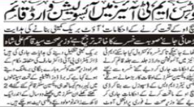
پشاور کی ایک جماعت الوداع میں اکیلا تھے بطور بچہ چنانچہ اعلان کیا گیا۔

پشاور کی ایک جماعت میں مارا گیا تھی۔ اس واقعہ نے شہر میں شدید ہلاکتیں مچا دی ہیں۔