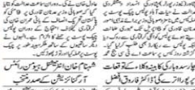
پشاور کی ایک جماعت الوداع میں اکیلا تھے بطور بچہ چنانچہ اعلان کیا گیا۔

پشاور کی ایک جماعت الوداع میں اکیلا تھے بطور بچہ چنانچہ اعلان کیا گیا۔ اس موقع پر والدین اور اساتذہ نے بچوں کو دلچسپ اور سبق آموز تقریریں سنائی۔