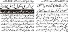
پشاور کی آفریہ کے کلب کی بنیاد پونے دو سال بعد خراب بنی تھی۔

پشاور کی آفریہ کے کلب کی بنیاد پونے دو سال بعد خراب بنی تھی۔ اس کی وجہ سے کلب کے اراکین نے شدید غم و غصہ کا اظہار کیا۔