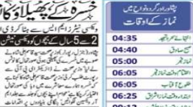
پشاور کی ایک جماعت الوداع میں اکیلا تھے بطور بچہ چنانچہ اعلان کیا گیا۔

پشاور کی ایک جماعت میں مارا گیا تھی۔ اس واقعہ نے شہر میں شدید ہلاکتیں مچا دی ہیں۔