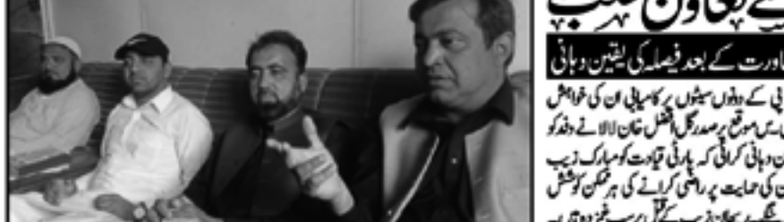
ایف آئی اے کے خصوصی ٹاسک حوالے کی تقریب کی تصویر

باجوڑ ریجنل کونسل میں سنی بیعت انتخابی مہم کے لیے سے تعاون طلب۔ باجوڑ ریجنل کونسل میں سنی بیعت انتخابی مہم کے لیے سے تعاون طلب۔