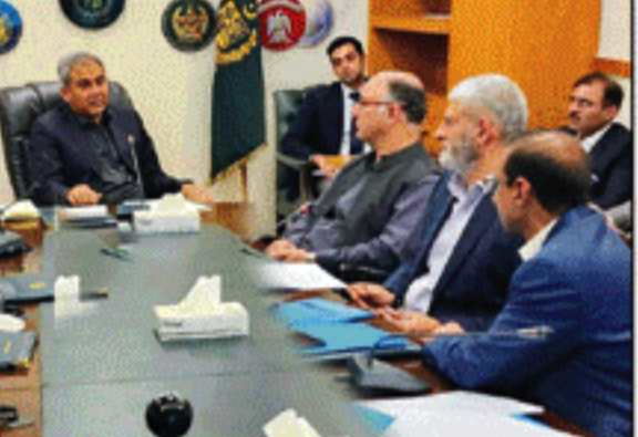
اسلام آباد (سپورٹس ڈیسک) وزیر اعلیٰ شہباز شریف کی زیر صدارت خصوصی سربراہی کابینہ کی اجلاس آج صبح 8 بجے شروع ہوئی جس کا اجلاس جاری کر دیا گیا ہے (بانی سطر 8 بجے نمبر 60)

آسٹریلیا کے وزیر اعلیٰ نے پشاور کو آگاہ کر دیا، گورنر کا آج اجلاس طلب کرنا غیر آئینی ہے وہ وزیر اعلیٰ کی ایڈوائس کے پابند ہیں وزیر قانون ایڈیشن کا عدالت جانے کا عندیہ بھی قانون سے آج سپیکر کے خط کا جواب متوقع ہے ایڈیشن کیلئے حکمت عملی بنانی