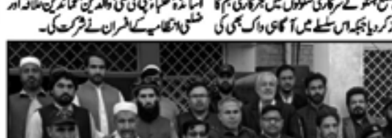
ہنگو سرکاری سکولوں میں شجر کاری مہم کی تصویر

ہنگو سرکاری سکولوں میں شجر کاری مہم آگامی واک۔ ہنگو سرکاری سکولوں میں شجر کاری مہم آگامی واک۔