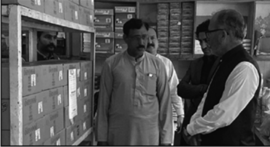
مردوان میں آتش بازی سامان اور پٹاخوں پر پابندی کی تقریب کی تصویر

مردوان میں آتش بازی سامان اور پٹاخوں پر پابندی۔ مردوان میں آتش بازی سامان اور پٹاخوں پر پابندی۔