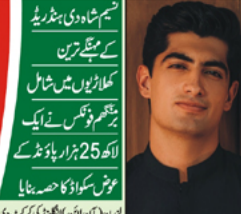
نہم شاہ دی بھڑیہ کے سب سے تیز ترین کھلاڑیوں میں شامل برقیہ فوٹس نے ایک لاکھ 25 ہزار پاؤنڈ کے عوض سکواڈ کا حصہ بنایا۔